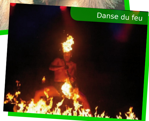
Danse du feu